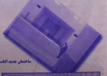
ساختمان جدید اناسی دانشگاه بهداشت