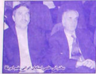
مسابقات علمی استانی از اینجلس استانی

در سال پیامبر اعظم (ص) هر ایرانی در هر جا که هست و به کارهای که مشغول است یک گام به جلو بر می‌دارد. امروز درس پیامبر اعظم (ص) برای امتش و برای همه بشریت درس عالم شدن قوی شدن درس اخلاق و کرامت درس رحمت درس جهاد و عزت و درس مقاومت است. ملت ما به شاگردی مکتب نبوی و درس محمدی (ص) افتخار میکند. امروز امت اسلام و ملت ما بیش از همیشه به پیغمبر اعظم خود نیازمند است.