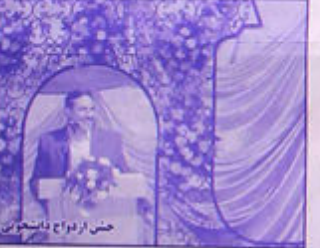
جلسه ترویج دانشجو