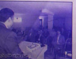
اجرای عبادت خدای تعالی