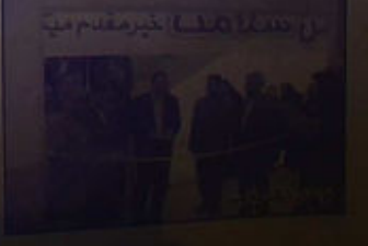
ساختمان جدید تأسیس دانشگاه بهداشت