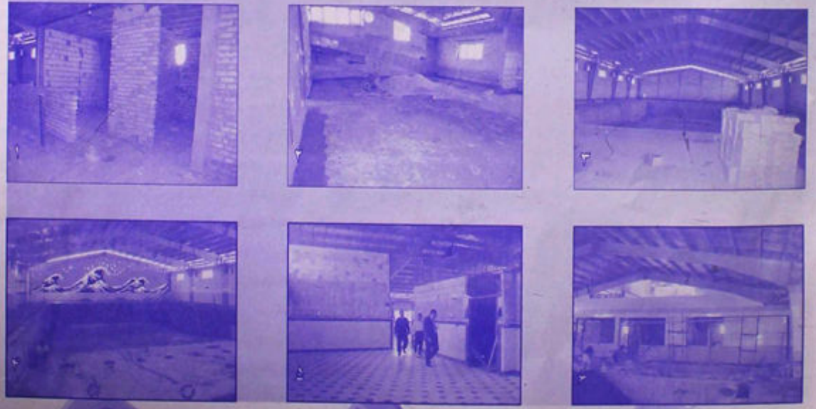
ساختمان جدید اناسی دانشگاه بهداشت