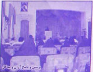
مسابقات علمی استانی از اینجلس استانی