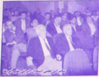
جلسه اینجلس استانی از اینجلس استانی