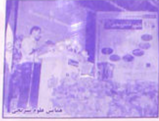
عناصیر علوم استراتژی

← عناصیر علوم استراتژی - ۲۲ شهریور ماه در محل ساختمان محققان استانی و دانشجویان گرایش ارشد و دکتری علوم پزشکی از ۹ تا ۱۱ آبانماه ۱۳۸۵ در دانشگاه علوم پزشکی گاشان برگزار شد.